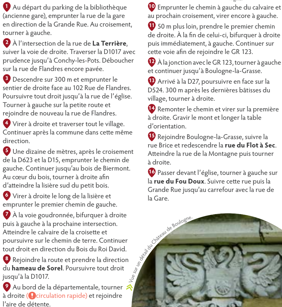
➤ Vue sur un détail du Château de Boulogne.