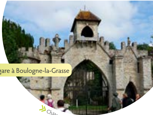
➤ Château de Boulogne.

En plein pays bocager, le château de Boulogne est une curiosité locale.