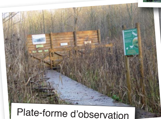
Plate-forme d'observation de la diversité de la mare.