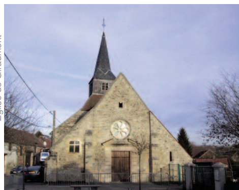
Église de Giraumont

À noter un autre évènement historique, les dernières grandes manœuvres organisées par Louis XIV en 1698. Pour simuler le siège de Compiègne, 60 000 soldats furent cantonnés à Coudun et ses environs.