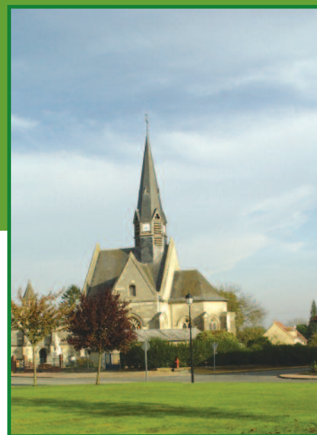
Église de Plessier-de-Roye

Au centre du village de Plessier-de-Roye, l'église Saint Jean-Baptiste fut construite au XIV ème siècle. Ce monument fut détruit durant la Guerre 14-18. Conservant ses caractéristiques architecturales de style gothique flamboyant, le bâtiment actuel repose sur les fondations d'origine mais avec des proportions plus modestes. Le portail occidental et le cloître en hémicycle établi en place de la nef d'origine, constituent une réelle curiosité. Cette église est un très bel exemple de reconstruction.