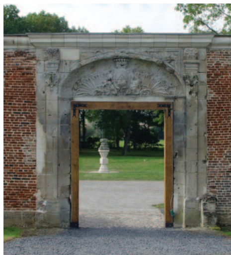
Ruines du château de Dives dans le parc communal.

Celui-ci est encore visible, à quelques centaines de mètres du point de départ.