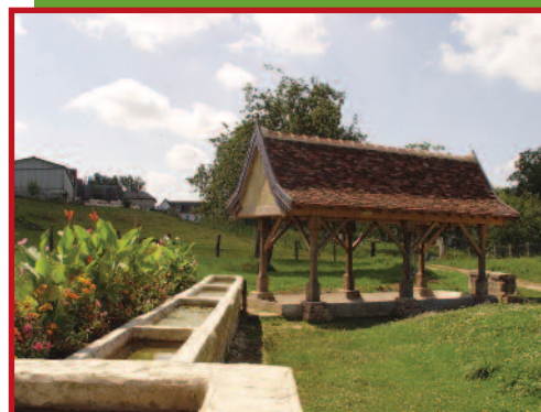
Lavoir de la fontaine Sorel.

dre le lieu-dit des Setiers . Au bout du chemin (8) bifurquer à droite et suivre le chemin de la Montagne du Paradis . Longer les restes de l'ancien Moulin éolien d'Elincourt. Continuer tout droit jusqu'à la lisière sud du massif. Au Terre Allard descendre le chemin encaissé de droite (9) et virer à droite (10) sur le chemin qui reconduit à Elincourt-Ste-Marguerite . Suivre le chemin jusqu'à la rue du Rhosne . Descendre la rue du Rhosne (11) sur plus d'une centaine de mètres avant de bifurquer une dernière fois à droite (12) pour rejoindre le Lavoir (1) .