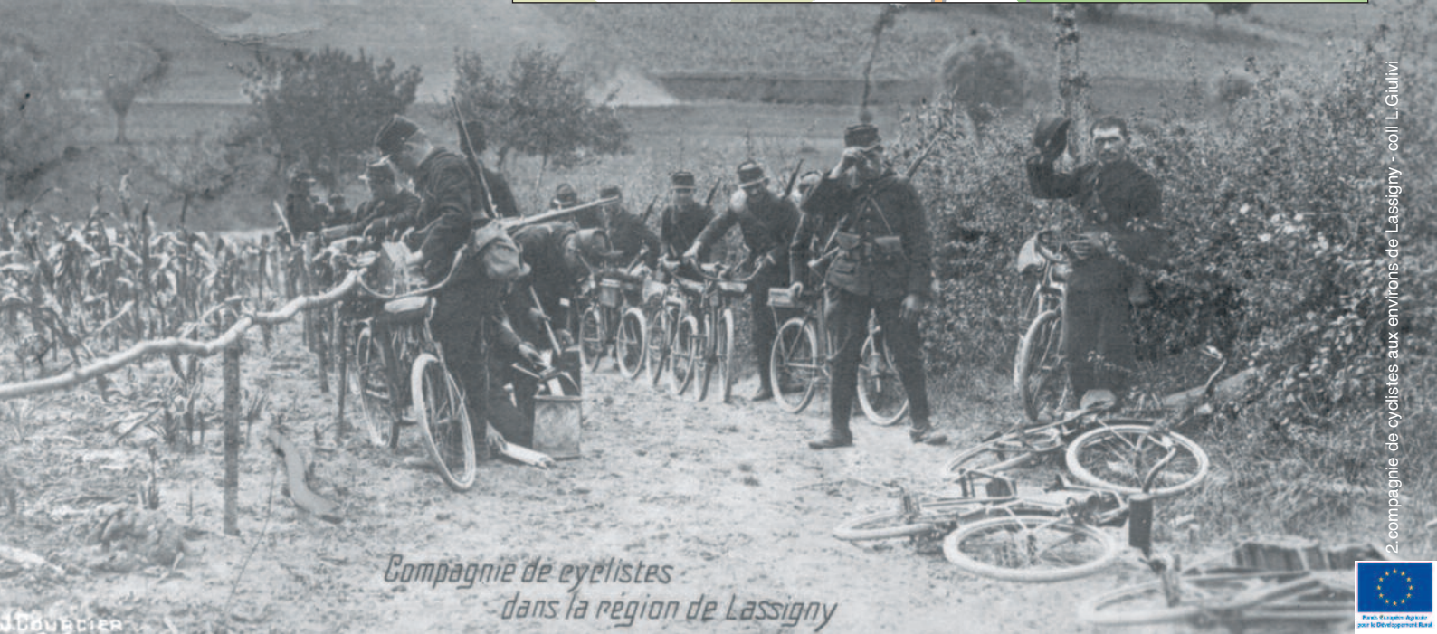
Compagnie de cyclistes dans la région de Lassigny

Réalisation & Conception : Service communication du Pays des Sources