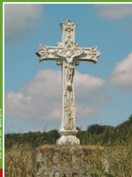
La Croix du Quesne