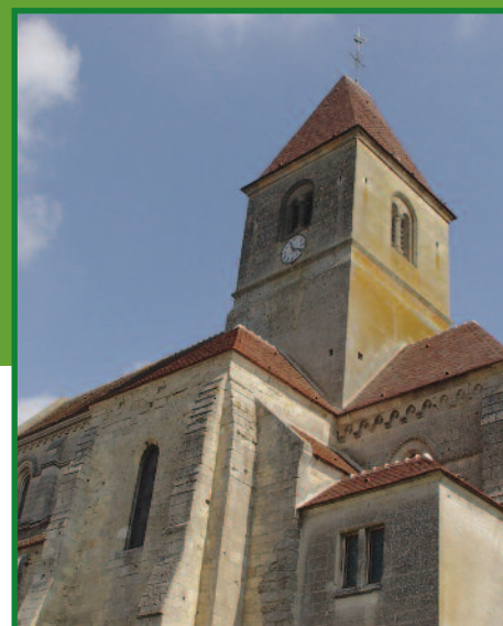
Église de Roye-sur-Matz