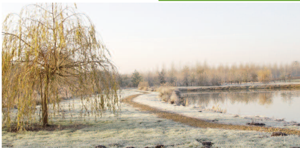
Étang de Roye-sur-Matz en face du château des Granges.

L'itinéraire principal du circuit des Bois de Roye emprunte des milieux fragiles notamment les berges du Matz et du ruisseau de la Fontaine Monchy. Afin de protéger ces sites, un itinéraire bis est conseillé aux randonneurs durant les périodes pluvieuses.