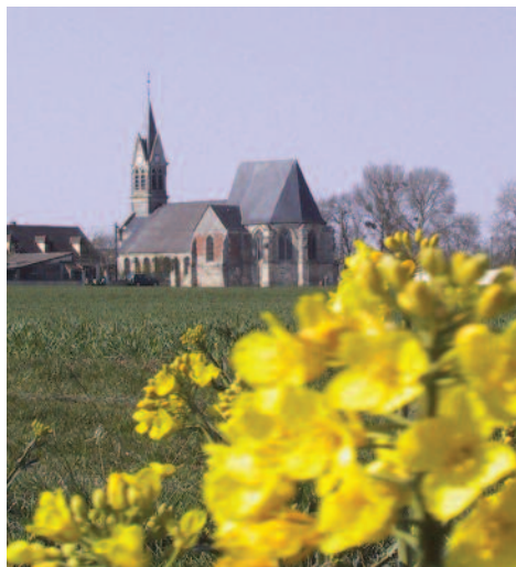
Vue d'Écuivilly et de son église.

la petite route goudronnée (6) , s'engager à droite pour atteindre le calvaire le long de la D76 (7) . Au croisement du calvaire tourner à droite, puis presque immédiatement après, emprunter la rue de gauche (8) se poursuivant dans la plaine. Suivre cette voie toujours tout droit. Traverser la D24 (Attention circulation rapide) (9) . Au bout du chemin virer à gauche (10) . Aux premières habitations d'Écuivilly, remonter la ruelle de droite (11) . Derrière les jardins particuliers (12) , suivre le tracé de l'ancienne voie ferrée sur la gauche. Continuer dans cette même direction jusqu'au bord de la D76 (13) . Franchir la route et emprunter le chemin longeant l' ancienne gare . De retour sur une petite route (14) , aller à droite jusqu'au Parc de la Fontaine Cailleux (15) (désormais Fontaine Saint Jean). Au niveau du Parc, tourner à gauche et traverser l'aire de détente pour rejoindre le sentier de la Fontaine Lematte (16) . À l'extrémité de la sente partir à droite au niveau de la ruelle du Prieuré (17) . Arrivé au Stop le long de la D24 (18) , bifurquer à gauche pour regagner la place communale (1) .